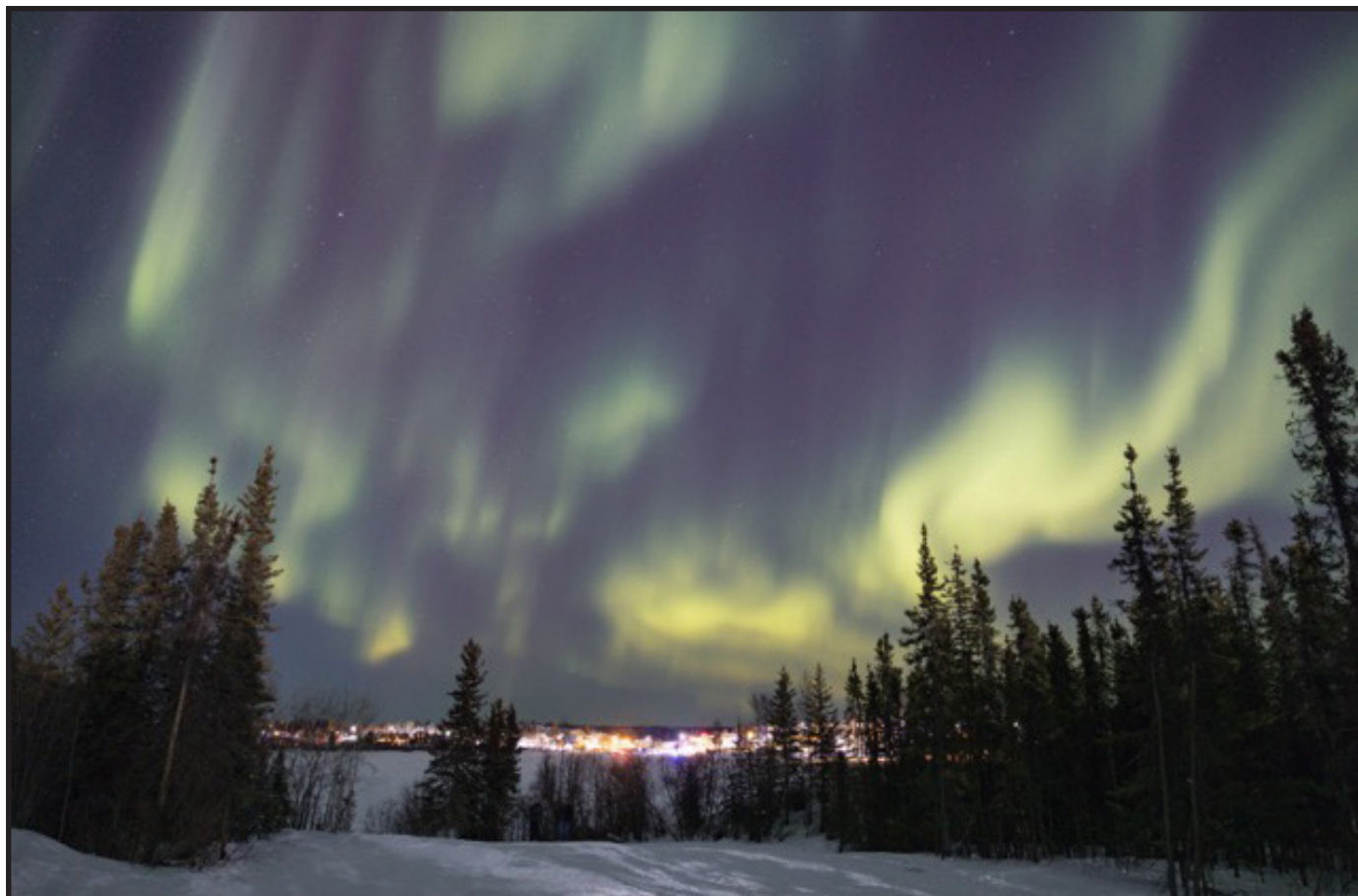
Photo prise dans la région de la baie Back de Yellowknife au début du mois d'avril 2024. Merci à tous les participants!

Gagnant du concours de photographie d'aurores (Capture the Aurora) : Jeff Ray Sanchez!